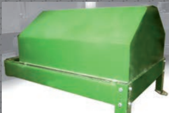
Motori elettrici da 22 a 45 Kw con riduttore