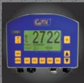
Una centralina di pesatura per il dosaggio dei prodotti gestita dal PC