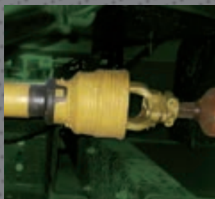
L'albero cardanico con bullone di tranciamento trasmette il moto dai riduttori alle coclee